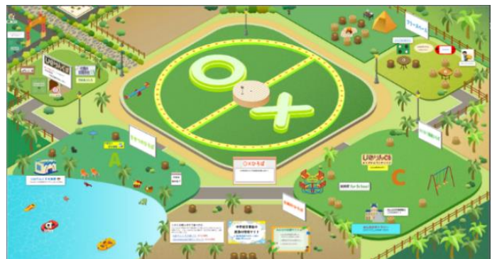
メタバース（仮想空間）の全体風景