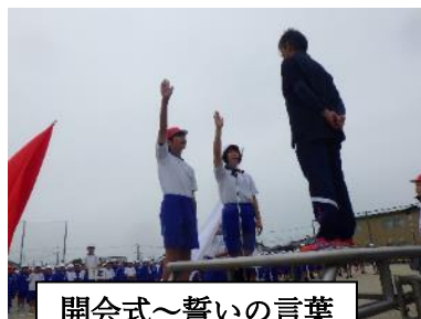
開会式～誓いの言葉