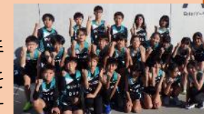
ゆいの杜小代表選手

【学校のHP】 http://www.ueis.ed.jp/school/yui/ 今年度も ほぼ毎日 ホームページを更新しています。学校の日々の様子をぜひご覧ください。