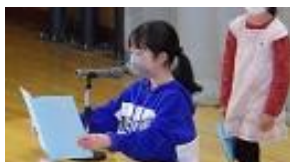
始業式で抱負を述べる代表

4月8日(金)に始業式を行い、12日(火)の入学式には50名の新入生を迎え、全校生411名、教職員38名、全16学級で令和4年度の陽南小学校がスタートしました。創立74年目を迎えた陽南小学校の、歴史と伝統、校風を継承しながら、さらに新たな歴史を刻んで参りたいと思います。保護者の皆様、地域の皆様には、引き続き、本校教育へのご支援・ご協力をどうぞよろしくお願ひいたします。