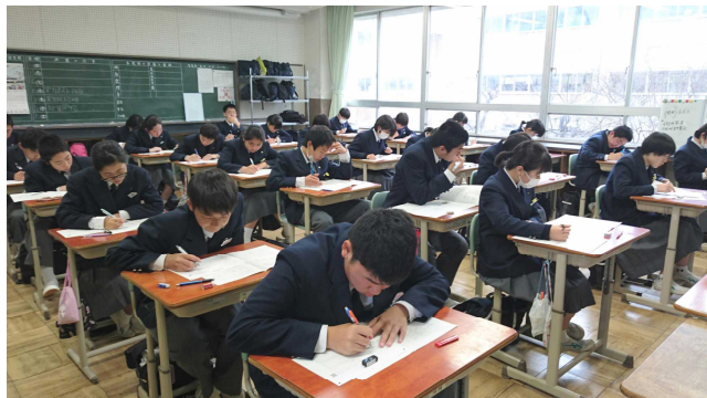
第1回実力テストの様子