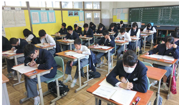
学習内容定着度調査の様子