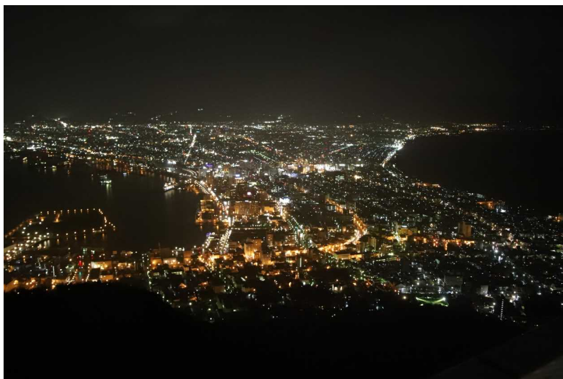
展望台からの眺望