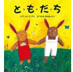
ロブ・ルイス作 評論社