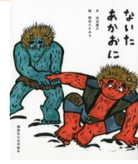
浜田廣介作 講談社