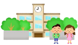
ザ・キャビンカンパニー作 あかね書房