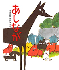
あきやまただし作 講談社