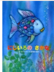
マーカス・フィスター作 講談社