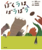
岡林ちひろ作 ロクリン社

御入学・御進級おめでとうございます。築瀬小学校での新しい1年が始まりました。 児童の皆さんの読書活動や学習活動の支援はもちろんのこと、皆さんがほっとくつろげる図書室にしていきたいと思ひます。本は心の栄養です。これからもたくさんの本に出会い、豊かな心を育てていってください。