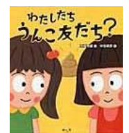
高橋秀雄作 今人舎