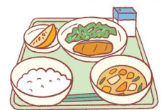
おいしいものと出会える