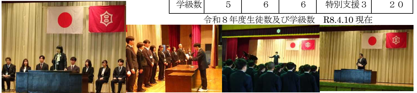
令和8年度生徒数及び学級数 R8.4.10 現在