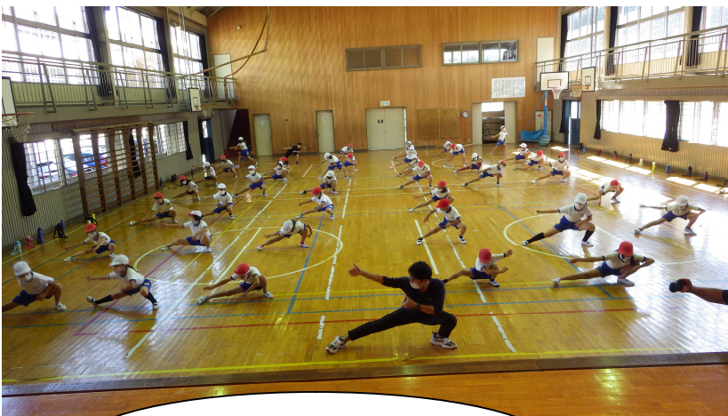
140 周年記念運動会 3・4 年 表現 お楽しみに！