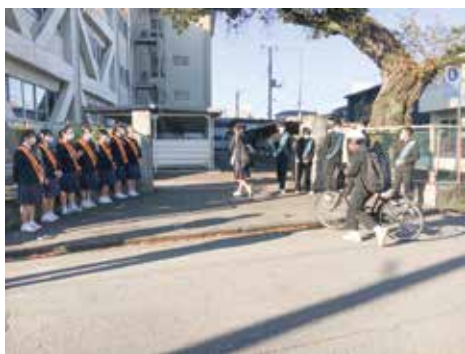
生活委員会によるあいさつ運動（星が丘中）