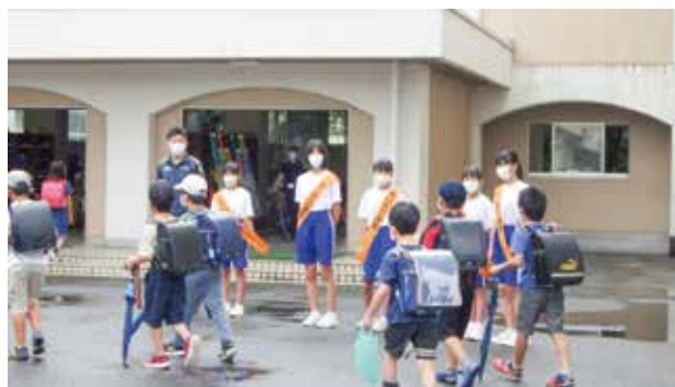
小中合同あいさつ運動（戸祭小）