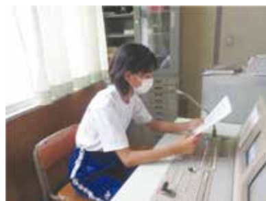
＊給食時の活動の様子です＊