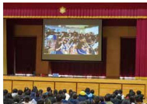
【映像による部活動紹介】