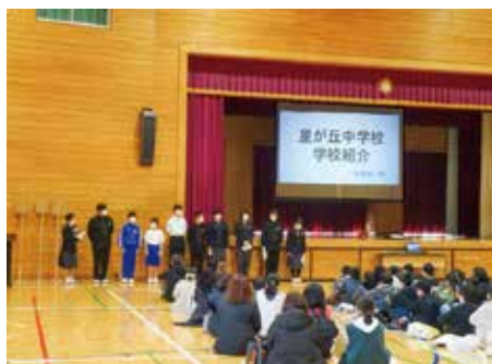
【学習と生活についての紹介】

今年度は1月20日（金）に実施され、中学校生徒会の執行部から、直接中学校の生活や学習の話を聞き、実際に授業を参観しました。部活動については、スクリーンによる映像で様々な活動のようすを視聴しました。中学校の生活について知る良い機会になったことと思います。