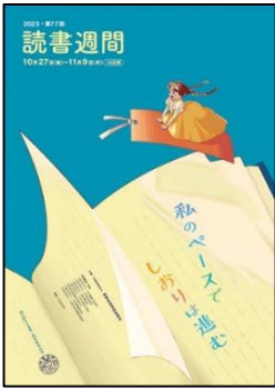
【第77回読書週間ポスター】

あき ひがく れるのが早く、夜が長く感じられます。また、秋の気温は人が集中するのに最適な気温なので、読書や勉強をするのにぴったりの季節とされています。「読書の秋」と言われるのは、そのためです。