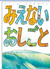
『みえないおしごと』 とくなが けい ぶん ちゅうおうこうろんしんしゃ 中央公論新社