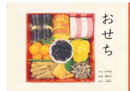
『おせち』 うちだ ゆみ ぶん 内田 有美：文・絵 福音館書店