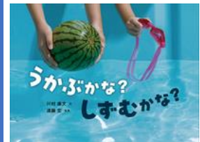
『うかぶかな？ しずむかな？』 かわむら やすみ ぶん 川村 康文：文 岩崎書店