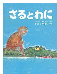
『さるとわに』 ポール・ガルドン：作 ほるぷ出版