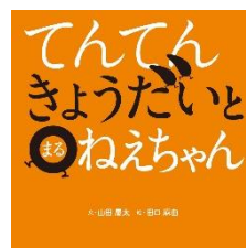
『てんてんきょうだいと まるねえちゃん』 やまだ けいた ぶん 山田 慶太：文 ポプラ社