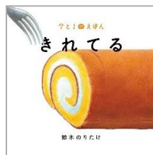
『きれてる』 すずき のりたけ ぶん 鈴木 のりたけ：作 ポプラ社