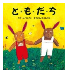
『と・も・だ・ち』 ロブ・ルイス：文 ひょうろんしゃ 評論社