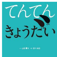
『てんてんきょうだい』 やまだ けいた ぶん 山田 慶太：文 ポプラ社