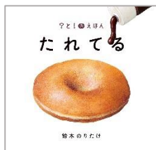
『たれてる』 すずき のりたけ ぶん 鈴木 のりたけ：作 ポプラ社