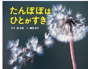
『たんぽぽはひとがすき』 しまた やすこ ぶん 嶋田 泰子：文 ポプラ社