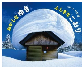
『おかしなゆき ふしぎなこおり』 かたひら たかし ぶん 片平 孝：文 ポプラ社