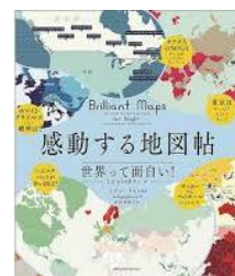
『感動する地図帖』 イアン・ライト：編著 日経ナショナルジオグラフィック