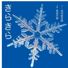
『きらきら』 たにかわ しゅんたろう ぶん 谷川 俊太郎：文 アリス館

ちいききょうぎかい こうにゅう あたら ほん 地域協議会に購入していただいた新しい本は、これか としよしつ なら よてい の ほん ら図書室に並ぶ予定です。としかんだよりに載せた本 のほか、きょうかしよ の ほん てんじつ さわる えほん などがはいります。お楽しみに！