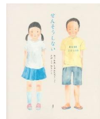
『せんそうしない』 たにかわ しゅんたろう ぶん 谷川 俊太郎：文 講談社