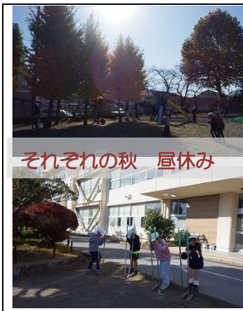
それぞれの秋 昼休み

写真の真ん中は、6年生がくじ引きで1年生を楽しませてあげていたのも私も引かせてもらったお守りです。友情運と徳運のお守りが当たりました。12月に入り寒さもいよいよ本格化しそうですが、芸術に読書にスポーツに、短い秋を子どもたちは堪能していたようです。