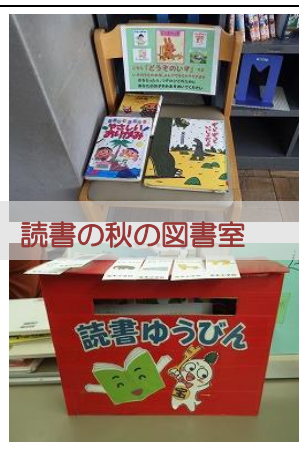
読書の秋の図書室