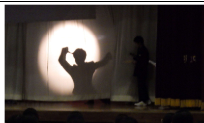
○シルエットクイズ(先生は誰?)