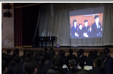
○思い出のスライドショー