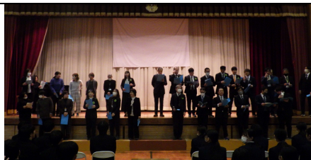
○熱唱!職員合唱「ふるさと」