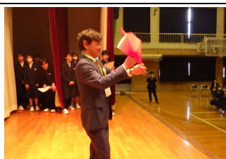
○自作紙飛行機の飛距離クイズ