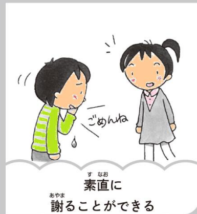
素直に 謝ることができる