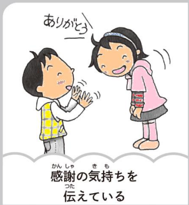
感謝の気持ちを 伝えている