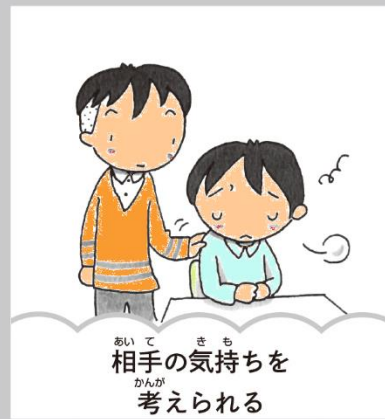
相手の気持ちを 考えられる