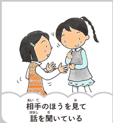
相手のほうを見て 話を聞いている