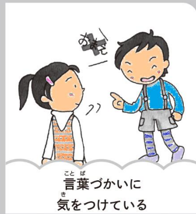
言葉づかいに 気をつけている