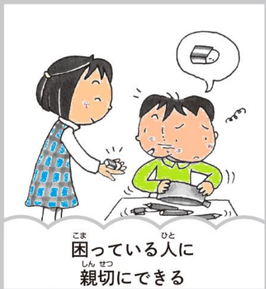
困っている人に 親切にできる