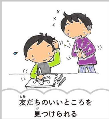
友だちのいいところを 見つけられる