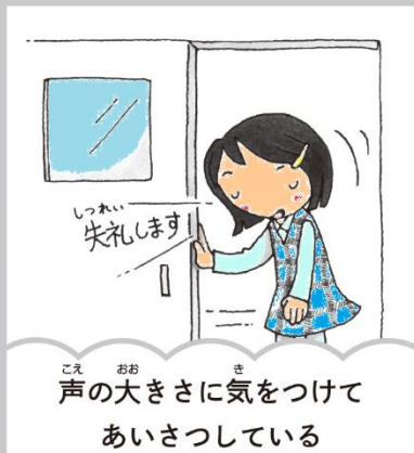
声の大きさに気をつけて あいさつしている