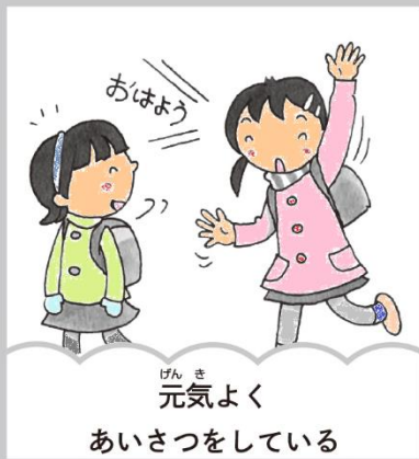
元気よく あいさつをしている