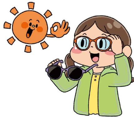
サングラスや紫外線 しがいせん カットメガネをする