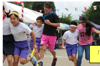
「心を一つに（二人三脚）」

保護者の方々には、地域種目・親子競技への参加、係の仕事など積極的に係っていただきご負担をかけている部分もあるが、今年度の反省でも概ね良い評価を得ている。