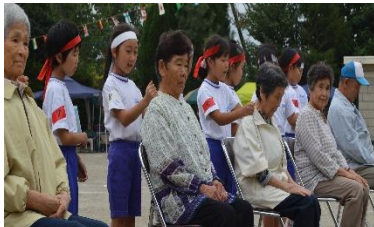
「おじいさん おばあさん ありがとう」