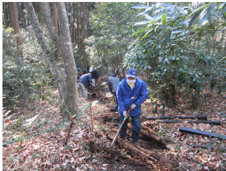
古い木材を片づけます