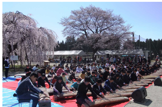
—昨年の孝子桜まつりの様子