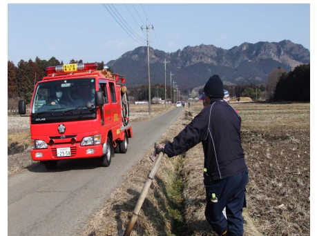
消防団が見回りに来てくれました