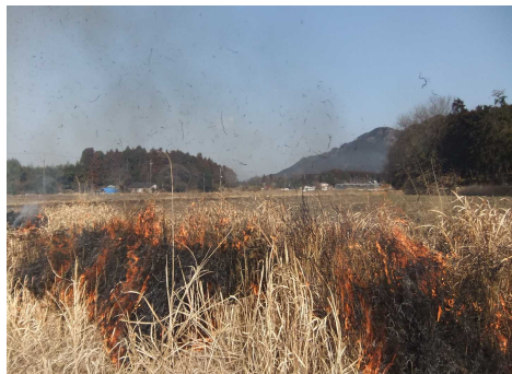
メラメラ燃えています！