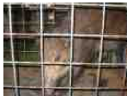
まだ子どものイノシシです