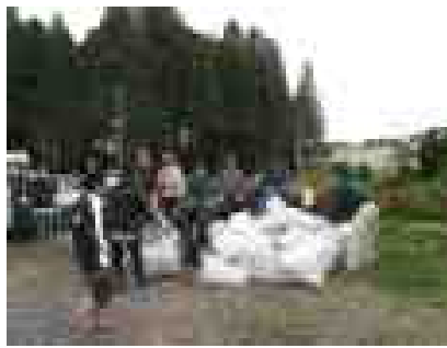
拾ったゴミの分別作業