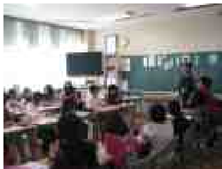
積極的に意見発表しました