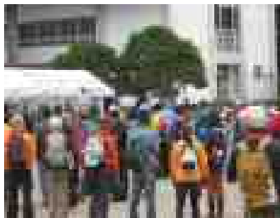
沢山の人が集まってくれました

沢山の方々の支えによってこの活動が成り立っています。本当に皆さんありがとうございました。来年もよろしくお祈いします。