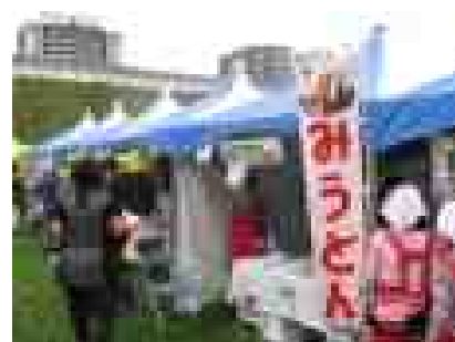
かたくりの会の“みうどん”の販売