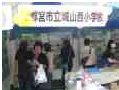
学校給食の紹介風景

10月6日（日）には、宇都宮城址公園で行われた「第8回うつのみや食育フェア」に今年もPRブースを設け、先生方による特色ある学校給食の紹介や、かたくりの会による“みうどん”の販売、PTAによる餅つきの実演・販売を行うなど、学校と地域の紹介に努めました。多くの人たちに学校や地域の魅力をPRすることができたと思います。