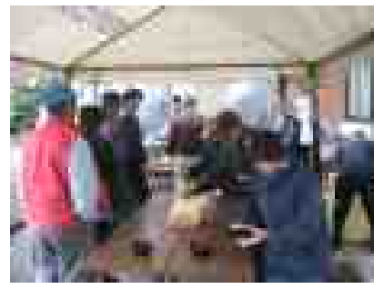
仕事の後のそばは最高！