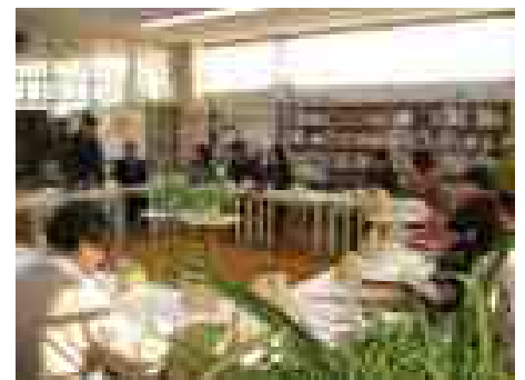
地域協議会の様子