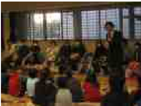
和久先生と息子さんのサプライズ演奏が！

また、地域協議会では、学校支援部会、広報部会、地域連携部会それぞれから活動報告が行われたほか、今後の活動の方向性などが協議されました。また、校長先生からは、来年度の新1年生の現時点での入学見込みについて報告があり、「確定数が14名、その他27名と面接済であり、今後一定数の入学申込みがあるだろう」との見通しが示されました。