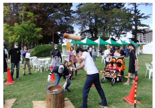
今年も市長さんが来てくれました

10月14（日）には、宇都宮城址公園で「第13回うつのみや食育フェア」が開催され、その会場に今年もPRブースを設け、先生方による特色ある学校給食の紹介や、PTAの皆さんによる餅つきの実演・販売、学校や地域を紹介するリーフレットの配布などを行いました。多くの人たちに学校と地域の魅力をPRすることができたと思います。