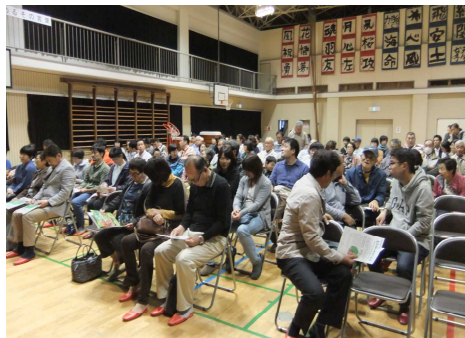
沢山集まってくれました