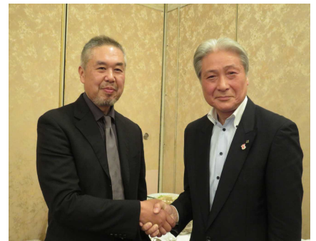
安孫子監督と知事さん