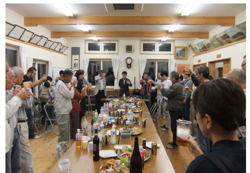
みんなで声高らかに、「乾杯！」