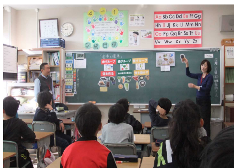
「食と体の健康」の授業