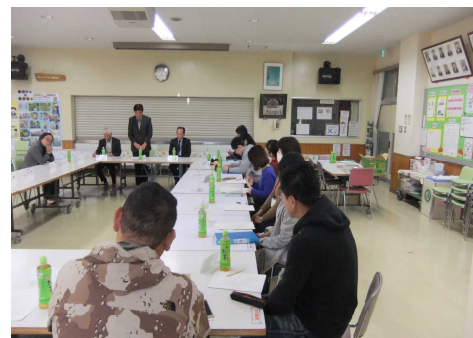
地域協議会の模様