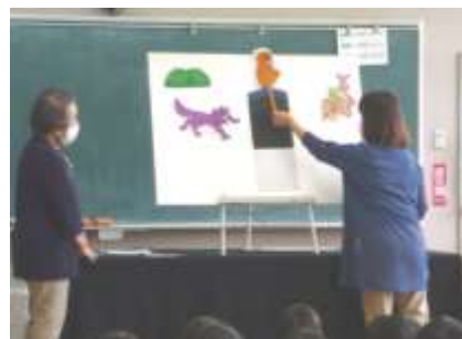
パネルシアター「ふるやのもり」