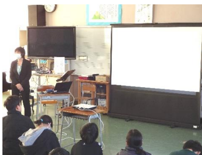
1/15 薬物乱用防止教室(6年生)