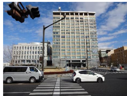
1/28 地域の施設見学 (3年生)