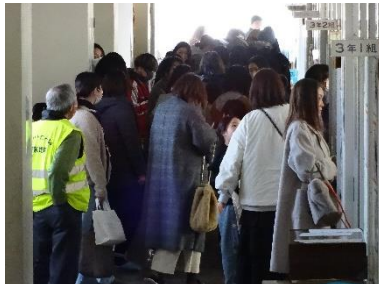
授業終了後の廊下の様子