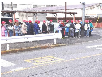
1/10 消防施設調べ(3年生)