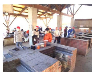
野外すいはんの様子

5年生が2月12日（水）～14日（金）の2泊3日の日程で、宇都宮市冒険活動センターを利用して「冒険活動教室」を行いました。