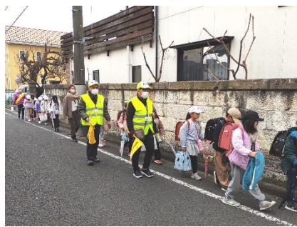
1/21 スクールガードボランティア