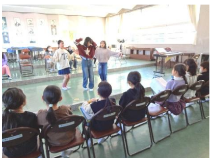
1/23 クラブ見学 (3~6年生)