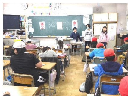
1/15 6年生へのプレゼントづくり