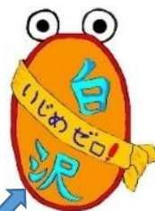
白沢小いじめゼロキャラクター ノ・ブちゃん

本市立小中学校では、いじめの根絶を目指し、学校と家庭・地域が一体となって「いじめゼロ運動」を推進しています。毎年5月を第1回目「いじめゼロ強調月間」に設定し、いじめ防止に向けた取組をいつも以上に実施することとされています。そこで、本校でも、この強調月間に合わせて、いじめゼロに向けた取組を行っていますので、主な二つの取組をご紹介します。