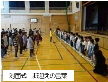
対面式 お迎えの言葉

10日(木)の入学式に38名の新入生を迎えました。「元気な挨拶、返事をしよう。人と仲良くしたり、人に優しくしたりして、楽しい桜小での学校生活にしよう。」と伝えました。返事がとても上手な新入生で、感心しました。