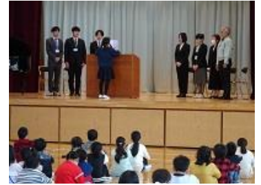
着任式 代表児童によるお迎えの言葉

今年度も「一人一人のよりよい未来のために、子どもたちの今に、全力でかかわる」を合言葉に、教職員一同力を合わせて「桜っ子」を育てていきます。保護者の皆様、地域の皆様には、引き続き、本校教育への御支援・御協力をどうぞよろしくお願いいたします。