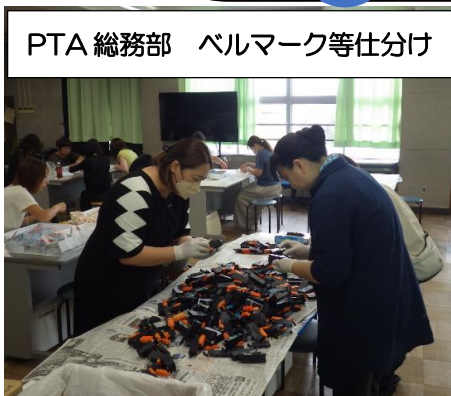
PTA 総務部 ベルマーク等仕分け