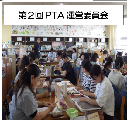
第2回 PTA 運営委員会

9月17日(水)には、第2回 PTA 運営委員会が実施されました。各専門部から上期の活動報告がありました。改めて、本校の教育活動への支援を実感いたしました。学校からも、今後の教育活動等の改善や見通しについて伝えさせていただきました。