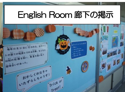
English Room 廊下の掲示

南校舎3階の学習室2を、夏休み明けから English Room(イングリッシュルーム)として活用を始めました。今まで各教室で実施していた外国語活動(1~4年生)・外国語科(5, 6年生)の授業で利用します。ねらいは、「より外国語に親しみやすい環境で子供たちの学びを実践する。」です。「掲示物も分かりやすく、授業しやすいです。」と、子供たちの反応も上々です。