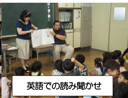
英語での読み聞かせ