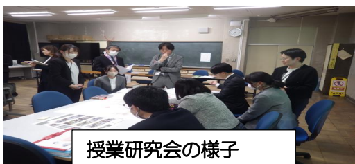
授業研究会の様子

12月17日（水）に校内授業研究会を実施しました。今年度は、学校課題「主体的・協働的に学習に取り組み、豊かに表現する児童の育成」を目指し研修を進めてきました。今回は、国語科で「言葉の力を高め、活用につなげる言語活動の工夫」をテーマに授業を実施しました。子供たちの言葉を意識しながら、真剣にいきいきと授業に臨む姿が見られました。