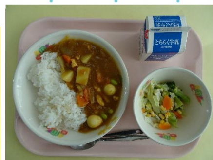
岡北小お話給食「しろちゃんとはりちゃん」