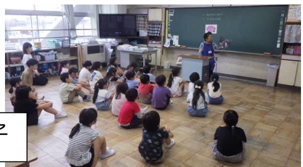
読み聞かせの様子