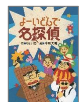
「 よーいどんで名探 偵 」杉山 亮：作 偕成 社