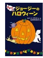
「おばけのジョージのハ ロウィン」ロバート・ブラ イト：作 徳間書店