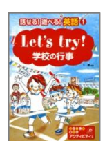
「 話せる！遊べる！英 語1 」下 薫：監修 あ かね書房