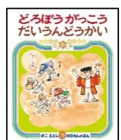
「 どろぼうがっこうだ いうんどうかい 」かこさと し：作 偕成社