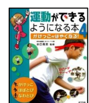
「 運動ができるよう になる本4 」水口高志：監 修 ポプラ社