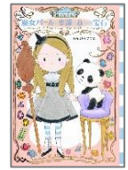
「魔女パールと幸運の 8つの宝石」あびる やすこ：作 講談社