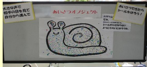
【企画委員によるあいさつオブジェクト】