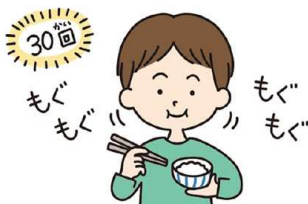
よくかんで食べる

だえき 唾液は、食べ物のカスを落としたり、歯を溶かす「酸」を中和 したり、さまざまな働きがあります。唾液をたくさん出すための ほうほう 方法をご紹介します。