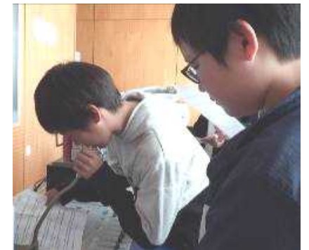
は 「歯と食事」に関する放送

ほけんしつ 保健室では、今後、給食後の歯みがきが、きちんとできているかを チェックする“歯垢の染め出し”（キラキラクラブ）を開催予定です（^^） さんか 参加は自由です。ぜひ来てね～☆