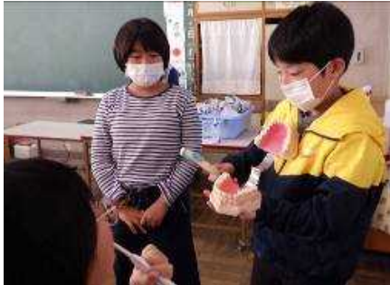
は 歯みがき隊！歯をみがくときのポイントを伝えています。