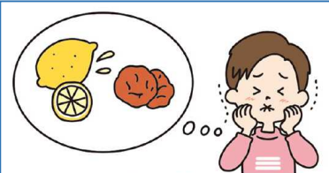
すっぱい食べ物を思い出す （レモン、梅干し、みかん）