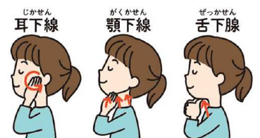
唾液腺をマッサージする