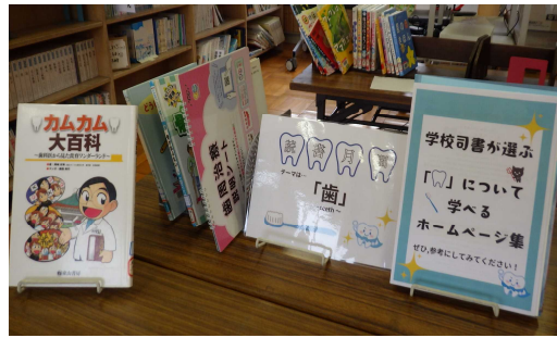
どくしょげっかん 読書月間