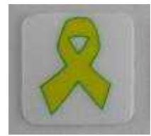
黄色いリボンのシール

5月をいじめゼロ強調月間として、いじめアンケート調査やいじめゼロ運動の実施などの他に、道徳の時間にいじめの予防や防止につながる授業を行うなどして、いじめゼロへの取組を推進していきます。また、学級活動などの授業や行事・委員会・縦割り班活動など学校活動全体を通して、思いやりや助け合いの大切さ、規範意識の高揚など心を育てて望ましい人間関係を築く力の育成を目指していきます。学校や学級の目標に向かって、子どもたちがみんなで考え、助け合い、頑張りながら活動することで、みんなのよさに気づき、自分の大切さとともに他の人の大切さを理解し、態度や行動に現れるように指導していきます。