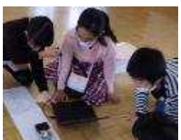
4年 プログラミング