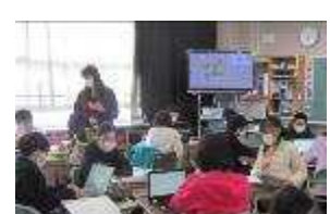
5年道徳 考えのまとめ