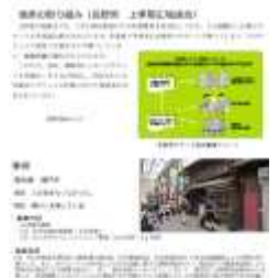
6年国語 町の幸福論のまとめ