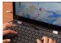
タイピングの練習

また、授業中や休み時間にも、AIドリルを使って漢字や計算問題、英単語に進んで何度もチャレンジする姿も見られ、繰り返し練習することで学力の定着につながっています。今後は、タブレットを家庭に持ち帰って活用する機会を増やしていきたいと考えています。