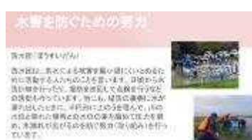
5年理科 川の災害のまとめ