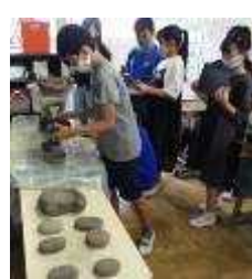
6年社会 土器の観察