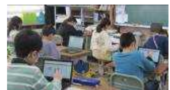
5年 AIドリルでの漢字練習

また、授業中や休み時間にも、AIドリルを使って漢字や計算問題、英単語に進んで何度もチャレンジする姿も見られ、繰り返し練習することで学力の定着につながっています。今後は、タブレットを家庭に持ち帰って活用する機会を増やしていきたいと考えています。