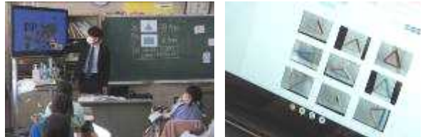
3年算数 「三角形」 研究授業

3年生の算数の「三角形」では、ストローで作成した三角形を撮影してタブレットの画面上で、三角形の違いを基に仲間分けをしました。グループ内で互いのタブレットを見せ合いながら、友だちの考えとの違いについて考えを深め、その後、学級全体で発表して多様な見方・考え方を確認しました。