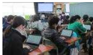
6年 卒業文集の編集