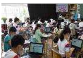
4年国語 意見の交流