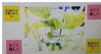
2年生活 植物観察のまとめ