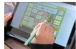
AIドリルでの英語学習