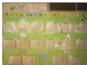
家庭学習頑張りコーナー

立春を迎えましたが、まだまだ寒い日が続いています。まん延防止等重点措置が取られている中、学校でも、感染予防に努めながら活動しています。授業参観などの行事について、急な中止や変更などでご迷惑をおかけいたしました。今後も状況を見ながら検討し、変更をお願いすることもあります。ご理解とご協力をお願いいたします。