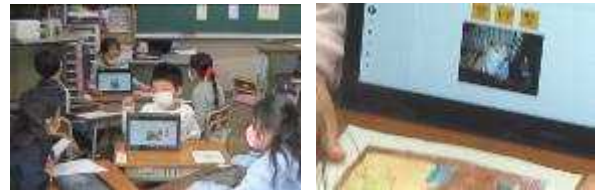
1年国語 「はっけんしたよ」 研究授業

1年生の国語では、動植物を観察して発見したことを、タブレットに「発見メモ」として記録し、それを使って伝えるための文を考えました。絵カードや写真、動植物の特徴を表したメモを見せながら友達に伝えることができました。