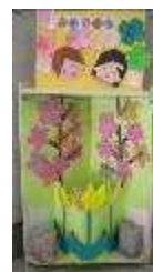
ハンドクラフト部の 皆様による作品