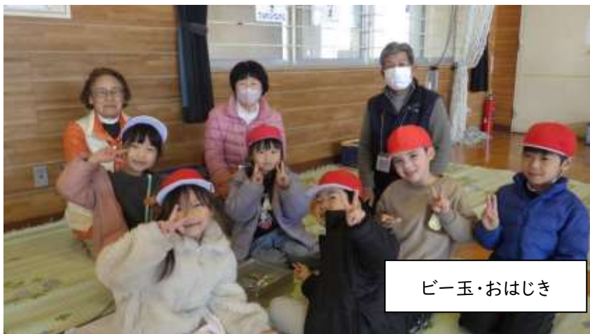
ビー玉・おはじき