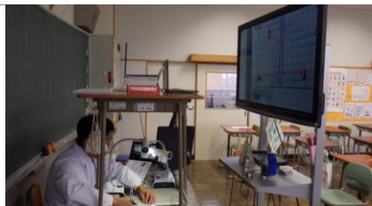
イカの解剖・化石を調べる(理科)