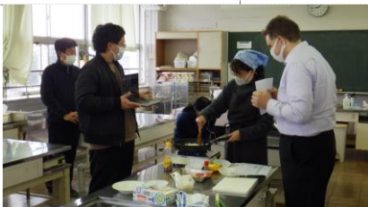
ホール先生と英語で料理(家庭科)