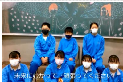
未来にむかって、頑張ってください