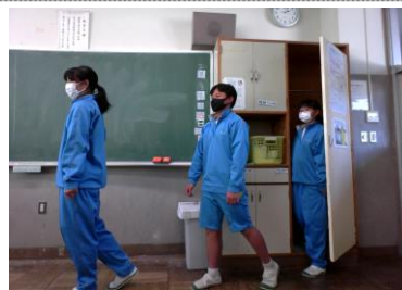
ピタゴラスイッチ 3組