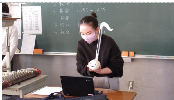
琴やオタマトーンを演奏(音楽)