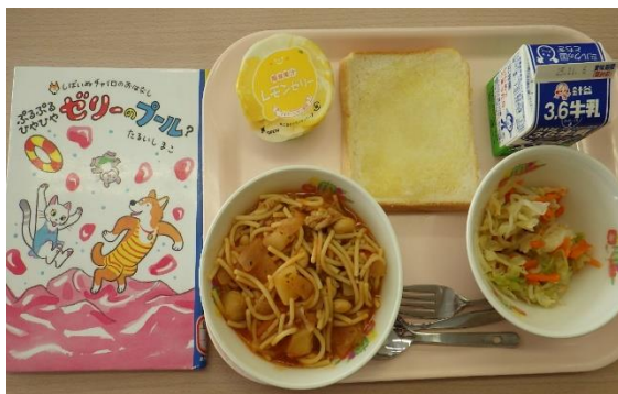
ぷるぷるひやひやゼリーのプール?

お話し給食を行うことで、お話しに興味をもち、本を読み、その中の興味のある食べ物があるとしてもきらいな食べ物でも食べることができるようになればという願いから始まりました。