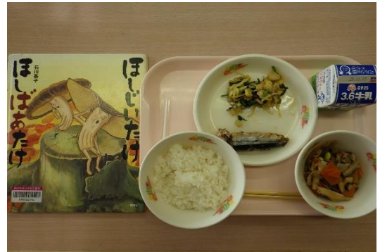
ほしじいたけほしばあたけ