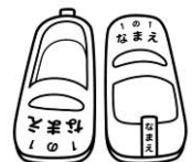
つま先とかかとの部分に 記名する。