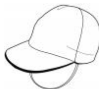
帽子は白色の方に記名する。