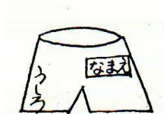
ハーフパンツの名札は 後ろの右側に付ける。