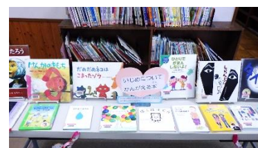
いじめについて考える本コーナー (図書室に設置)