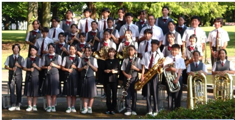
第31回東関東吹奏楽コンクール 9月7日(日) カルッツかわさき(神奈川県川崎市)

8月9日(土)に、県吹奏楽コンクール中学生の部A部門の代表選考会が行われました。練習の成果を發揮し、見事、東関東吹奏楽コンクールへの出場を決めました。吹奏楽部の皆さん、おめでとうございます。また保護者の皆様、引き続きご支援よろしくお願いたします。