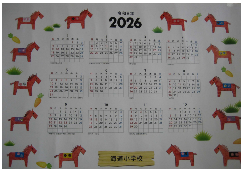
わかば学級の児童が作ってくれました