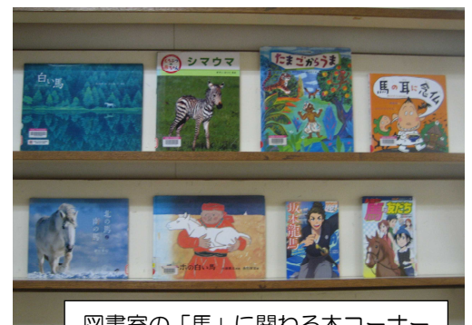
図書室の「馬」に関わる本コーナー