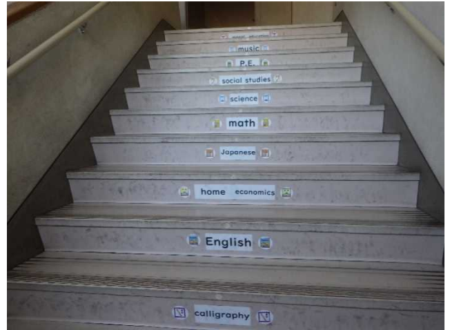
英単語の種類 食べ物 天気 曜日 教科 行事 スポーツ 文房具 国名等