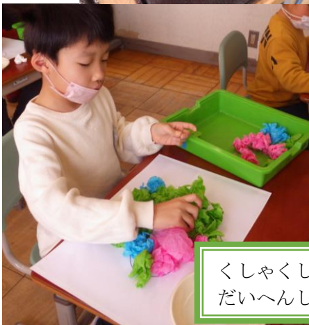
くしゃくしゃしたら だいへんしん