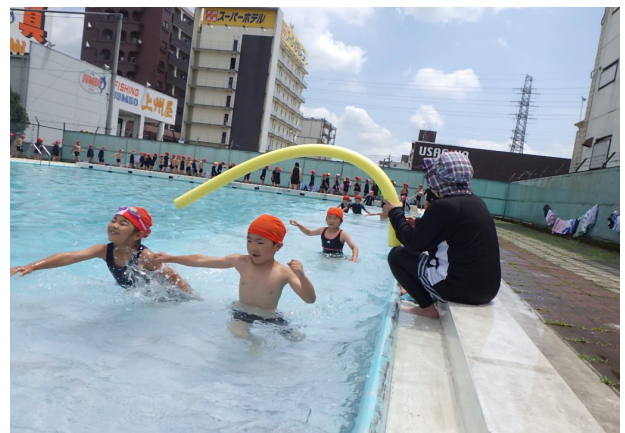
水泳の授業も楽しく取り組んでいます。