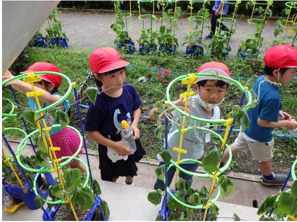
あさがおの水やりの様子