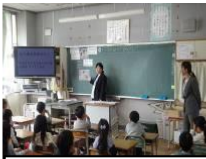
栄養士の授業参画