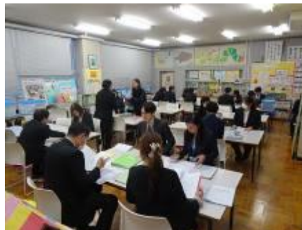
表簿閲覧の結果伝達の様子