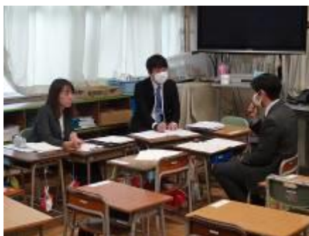
教科ごとの振り返りの様子