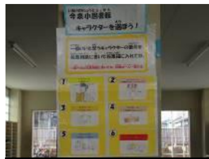
図書館キャラクター