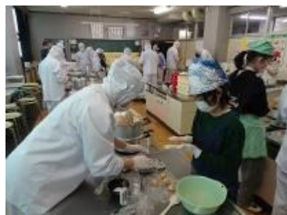
白楊高校生徒とのおやつ作り