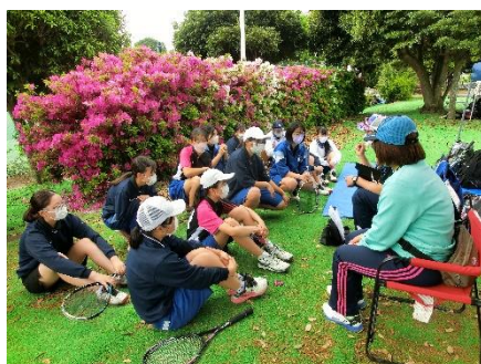
作戦会議中の女子テニス部

5月6日（金）から中体連の地区春季大会が実施されました。多くの競技で保護者の観戦が可能となり、私も久しぶりに各会場を訪れ、生徒の躍動する姿を間近に見ることができました。悔しい思いをした部もありましたが、歯を食いしばって頑張る姿は美しかったです。3年生最後の夏の大会で、さらに成長した姿を見せてくれるでしょう。