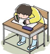
机と顔が近い(猫背)