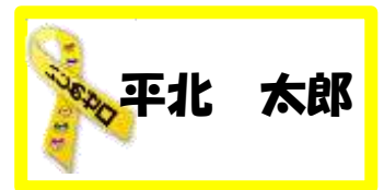
児童が着用しているいじめゼロ名札