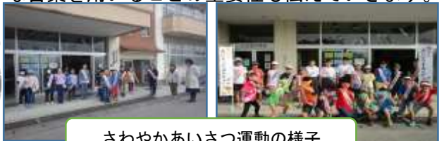
さわやかあいさつ運動の様子