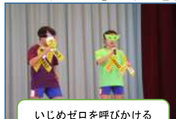
いじめゼロを呼びかける平北レンジャー

いじめゼロアンケートやQU調査等を活用し、いじめの防止、早期発見・対応に努めています。いじめゼロ集会では、児童会や平北レンジャーが中心となっていじめは絶対にいけないことを伝えてくれました。継続して、帰りの会では、「友達のよいところ」を発表する場を設けたり、「ありがとうカード」の活用を行ったりしています。