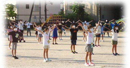
【ラジオ体操開校式】

夏休みの宿題や作品を見せ合いながら夏休みの思い出を目を輝かせて語る子供たち。夏休みの様々な体験を通して、心も体もひとまわり大きくなったように感じます。事件や事故もなく無事に元気に過ごすことができましたのも、保護者や地域の皆様のおかげです。ありがとうございました。