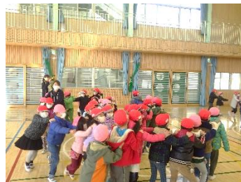
じゃんけん列車で大盛り上がり

本校における「幼小連携」の恒例行事である「二葉幼稚園との交流会」が行われ、1年生児童26名が園児たちを「おもてなし」してくれました。じゃんけん列車で楽しく遊んだ後、グループに分かれて、校内のいろいろな部屋を見学する「学校探検」、体育館での「羽子板遊び」「手作りプレゼント贈呈」など、お兄さん・お姉さんとして一人一人の子どもたちが活躍しました。