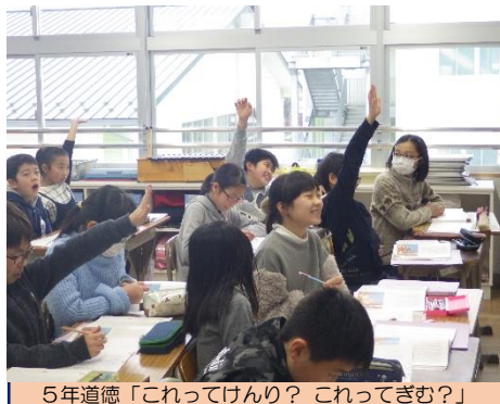
5年道徳「これってけんり? これってぎむ?」