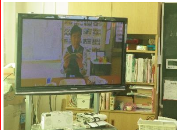
ビデオに登場したのは・・・

2月3日は節分の日。近頃では、恵方巻を食べる習慣も広まってきたようです。本校では、セルフ手巻き寿司に替わってセルフ恵方巻が出ます。1年生にとっては初めての体験。恵方巻の作り方のビデオを視聴した後、1年生の子どもたちは一生懸命に恵方巻を作り、おいしそうにほおばっていました。