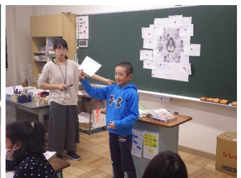
3年保健「健康な生活」