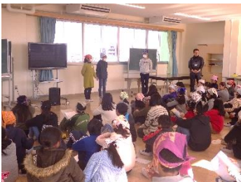
引き継ぎ式は、多目的室で行われました

6年生から5年生へ、最上級生としての思いも含めて東小の伝統がしっかりと引き継がれていることを実感しました。