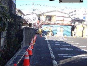
重機も入ってブロック塀の撤去を行っています (2/18撮影)