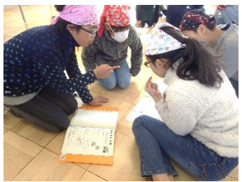
しっかりと引き継ぐ6年生。真剣に話を聴く5年生