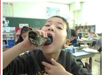
東北東を向いてガブリ!