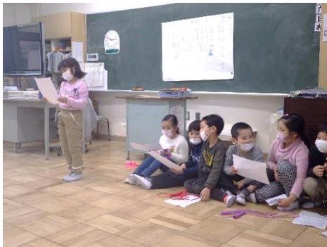
1年生活「できるようになったこと」

引き続き行われた学級懇談会にも多くの保護者の皆様の参加をいただきました。子どもたちの成長ぶりや次年度に向けての取り組みなど、有意義な話し合いができたことと思います。誠にありがとうございました。