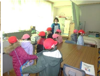
園児を連れて学校探検(保健室)