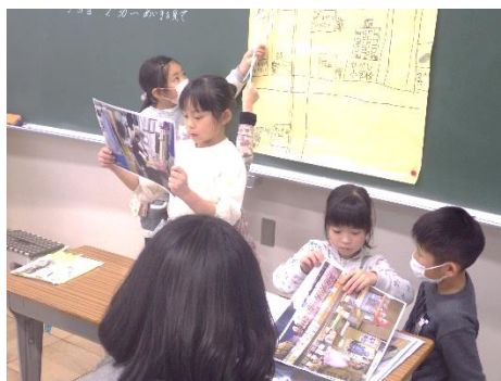
2年生活「活動報告会をしよう」