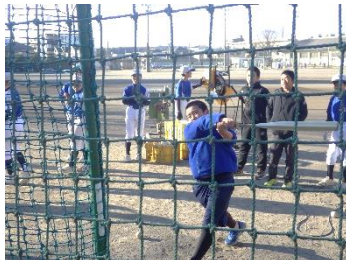
興味のある部活動を見学中、野球部の体験がありました