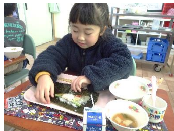
具材を載せて優しく巻いたら