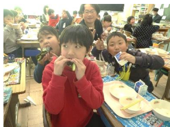
3年生の教室でも大盛り上がり