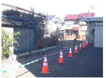
学校教材園から子どもの家方向を臨む (2/18撮影)

すでにご存じの通り、本校の敷地西側にあるブロック塀の撤去作業が本格的に始まりました。この後、新しいフェンスが設置される予定になっています。工事は3/7(木)まで続けられる予定ですので、お車での来校の際は、十分に注意してください。また、近隣住民の方々には、工事車両の往来や工事に伴う騒音等ご迷惑をおかけしておりますが、ご理解とご協力をよろしくお願いいたします。