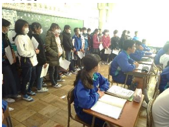
授業の様子を間近に参観させていただきました